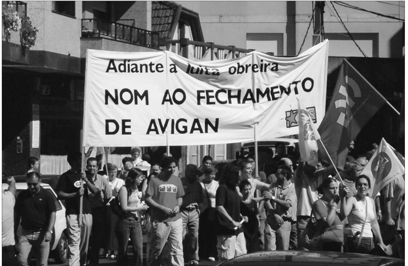
A libertação nacional fai parte da luta de classes