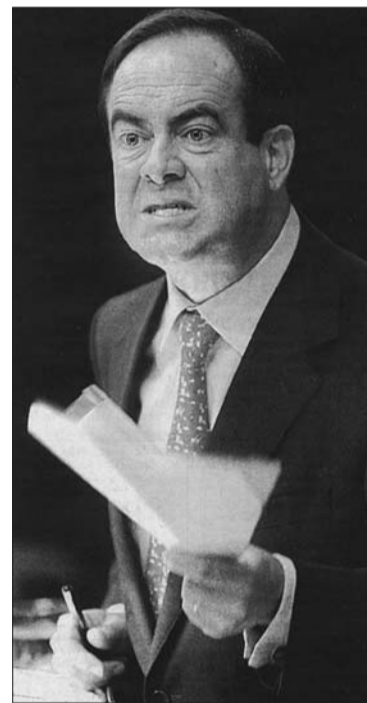
A verdadeira cara do PSOE

País os diversos sectores, mesmo para além do próprio independentismo, que somos por uma saída democrática, autodeterminista, como única possibilidade de desenvolvimento e construção da nossa verdadeira identidade nacional: a galega.