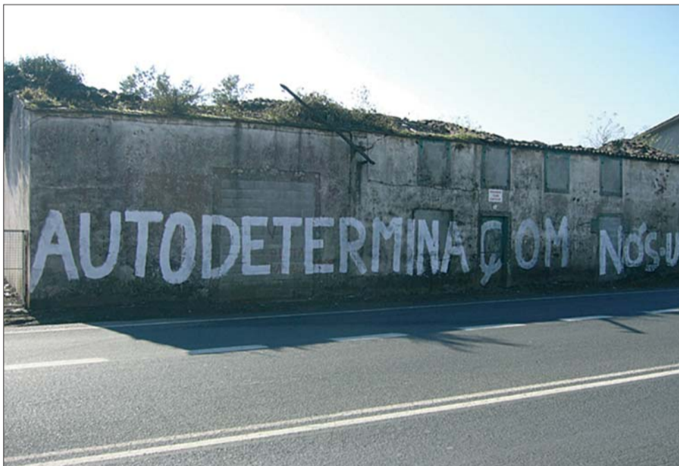
As reivindicações autodeterministas na rua da mão da esquerda independentista

zações contra a LOU, as massivas manifestações contra os responsáveis pela catástrofe sócio-ambiental do Prestige e, finalmente, as grandes mobilizações contra a Guerra imperialista no Iraque, demonstraram que, apesar da dureza dos anos de aplicação de políticas agressivas a nível ideológico, mediático e repressivo, um certo nível de resistência subsiste em importantes sectores sociais da Galiza. Mas, infelizmente, a falta de referentes políticos claros quanto à necessidade de construir umha alternativa anticapitalista e soberanista faz com que alternem os períodos de espontâneas vagas mobilizadoras com a desmotivação subsequente da falta de objectivos tácticos enquadrados numa estratégia revolucionária, que acaba cedendo a gestom dos refluxos e ressacas à direcção de um nacionalismo autonomista e institucionalizado.