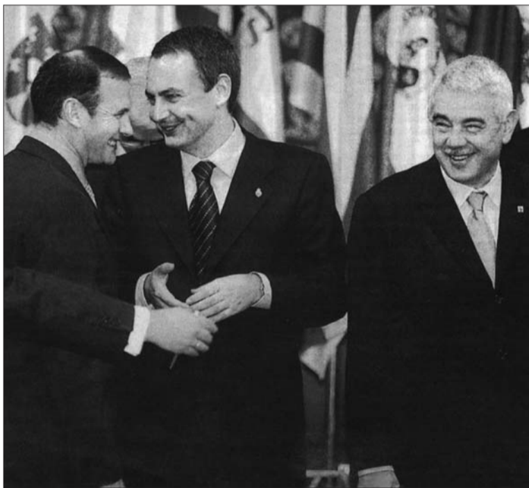
O PNB pactuou com o rosto amável do espanholismo