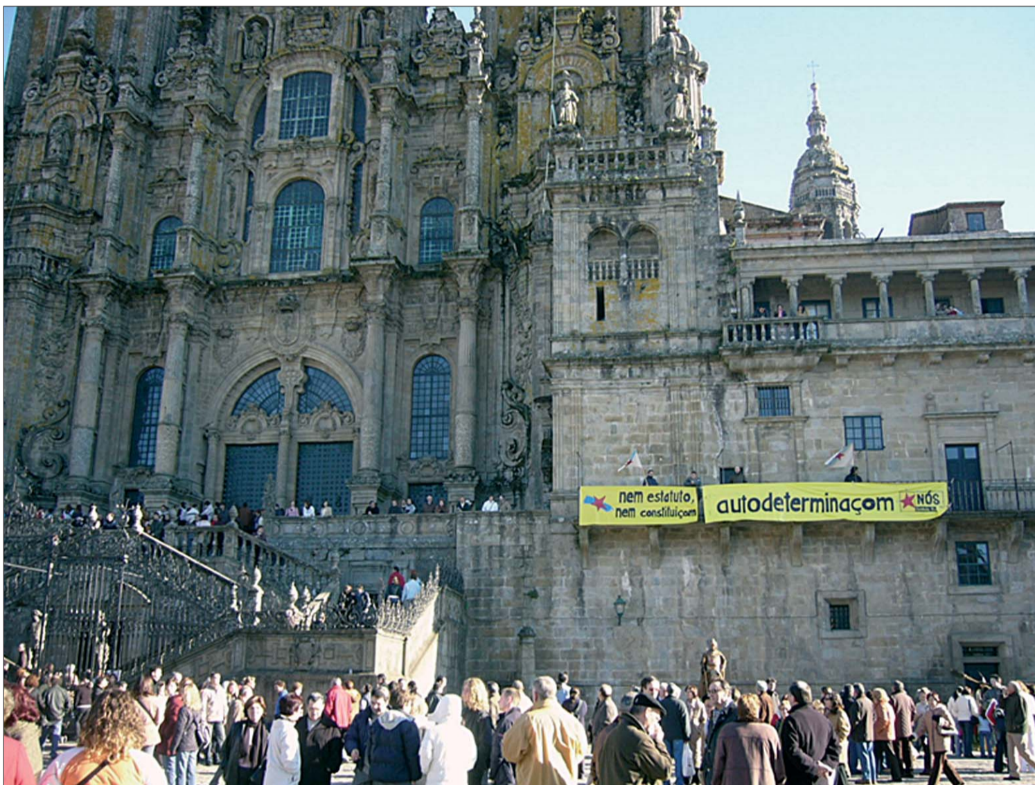
Compostela, 6 de Dezembro de 2004

Porém, as greves gerais de 2001 e 2002, as mobili-