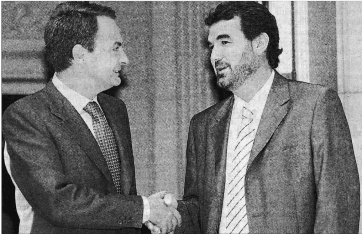
PSOE e BNG, cada vez menos diferenças