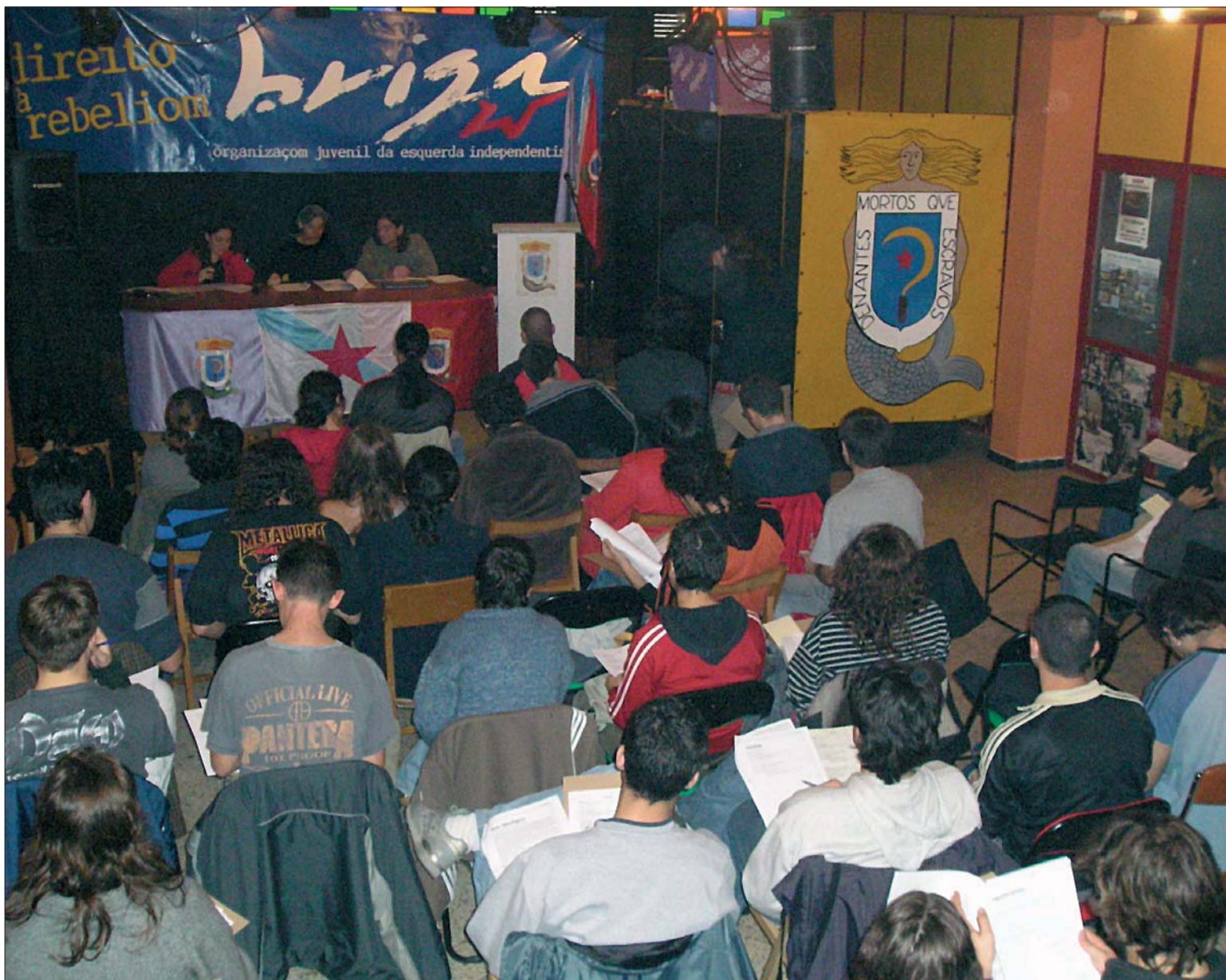
Congresso Nacional Constituinte de BRIGA, Ferrol, 16 de Outubro

guês polo Estado proletário é impossível sem umha revolução violenta" , mas também deve ser capaz de multiplicar as oportunidades que brindam as tmidas liberdades burgueses conquistadas pola classe obreira. Nem podemos abraçar as ilusões do parlamentarismo, nem renunciar dogmaticamente à sua utilização.