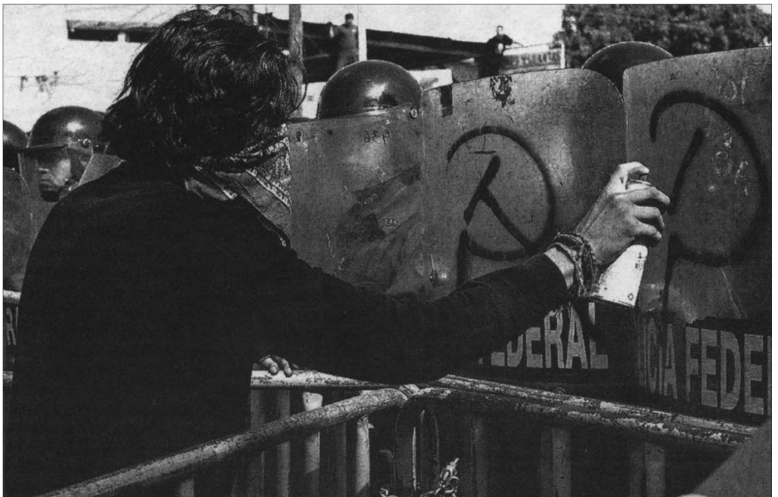
Os métodos de luta nom definem per se a linha política e os objectivos de quem os pratica

aos interesses da pequena burguesia, seguindo palavras de ordem "radicalizadas" e "incendiárias", mas esvaziadas de conteúdo, foi um dos mais habituais erros cometidos noutros processos e momentos históricos, mas que a dilatada experiência revolucionária tem demascarado, e dos quais cumpre aprendermos para nom voltar a repeti-los.